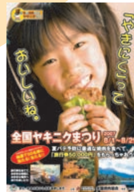
キャンペーン用ポスター

8月29日をヤキニクの日とし、毎年焼肉需要期の夏場に実施している販促キャンペーンです。(キャンペーン期間8月1日～8月29日)その年の企画内容に基づいて、期間中さまざまな景品が当たるスピードくじや、各店で独自に工夫を凝らしたヤキニクの日の当日販促、更には福祉施設への食材、食事を提供するボランティア活動などを実施。J.YのPRと売上拡大に努めてまいります。