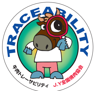
J.Y安全・安心キャラクター「トレサ君」